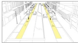
Bike Lanes Carrils de Bicicleta